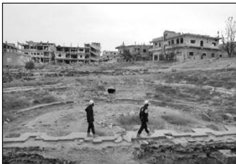
Des membres de casques blancs en train d'inspecter les dégâts sur un site de ruines romaines à Daraa

cisé que 422 secouristes et membres de leurs familles avaient été acheminés à travers le plateau du Golan occupé par Israël, et non 800 comme le ministère des Affaires étrangères l'avait annoncé dans un premier temps.