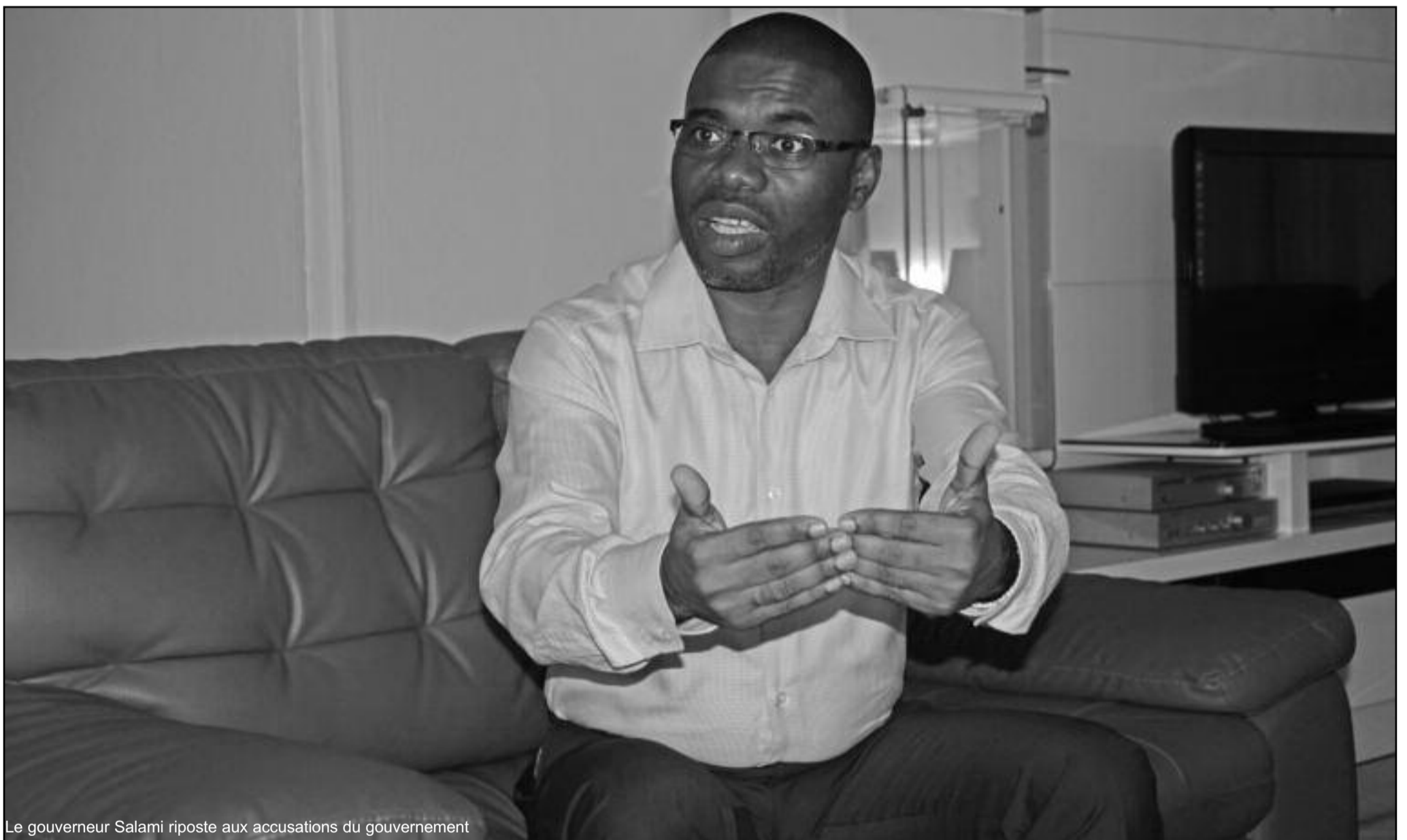
Le gouverneur Salami riposte aux accusations du gouvernement