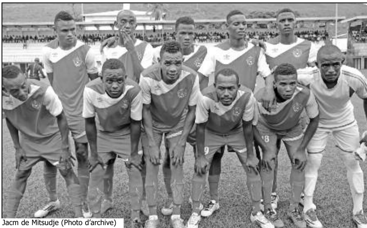
Jacm de Mitsudje

Des supporters de Mbadjini s'efforcent de justifier le duel de Nyumamilima (Etoile Polaire # Etoile du sud : 0-0), tenu dans un climat très froid. Etoile Polaire, l'un des clubs réputés intraitables à