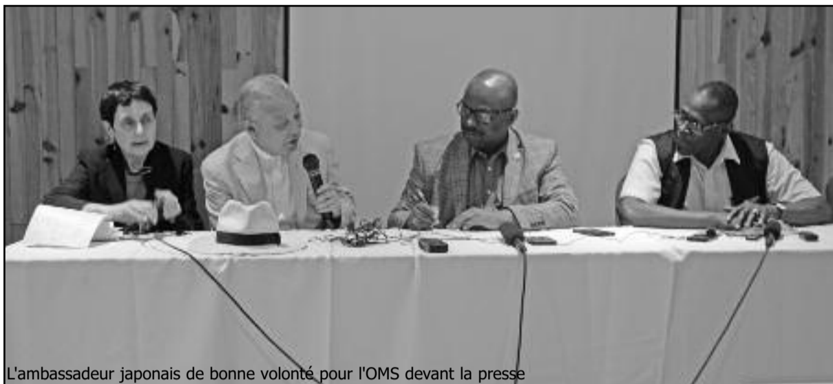
L'ambassadeur japonais de bonne volonté pour l'OMS devant la presse

« Nous avons parlé de cette prévalence qui est anormale de façon très