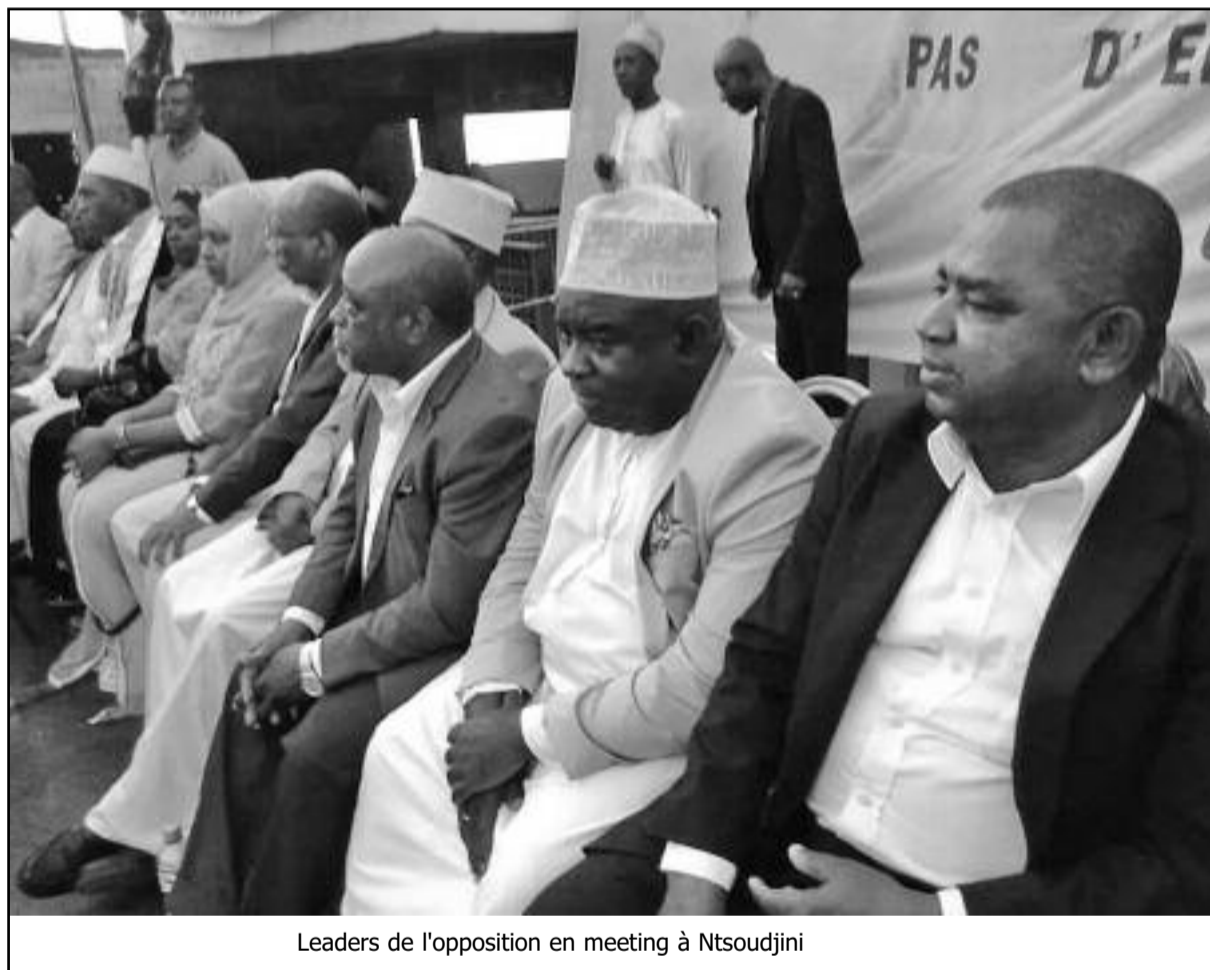
Leaders de l'opposition en meeting à Ntsoudjini